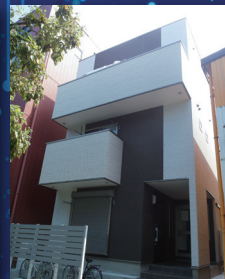
プログラミング教室