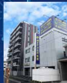
プログラミング合宿所(左)と教室(右)

IT・AI人材が世界で2020年に37万人(日本で5万人)、2030年に79万人(日本で10万人)以上 不足 すると日本の経済産業省が発表しています。これらの人材は現在、 企業からの争奪戦 になっており、スキルを持った人の 年収も右肩上がり で上昇し続けています。しかしながら、日本はこの分野の人材が極端に不足しており、世界からかなり遅れをとっていると言わざるを得ません。日本でも遅ればせながら、2021年から中学校、2022年からは全ての高校で プログラミング教育が義務化 され、2024年から大学入試でパソコンを使うテストが導入される予定です。