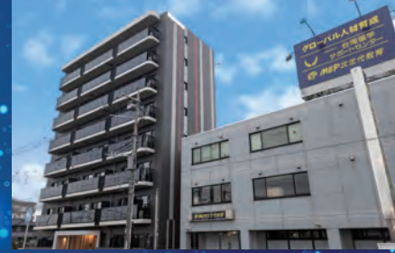
プログラミング合宿所(左)と教室(右)

IT・AI人材が世界で2020年に37万人(日本で5万人)、2030年に79万人(日本で10万人)以上不足すると日本の経済産業省が発表しています。これらの人材は現在、企業からの争奪戦になっており、スキルを持った人の年収も右肩上がりで見続けています。しかしながら、日本はこの分野の人材が極端に不足しており、世界からかなり遅れをとっていると言わざるを得ません。日本でも遅ればせながら、2021年から中学校、2022年からは全ての高校でプログラミング教育が義務化され、2024年から大学入試でパソコンを使うテストが導入される予定です。