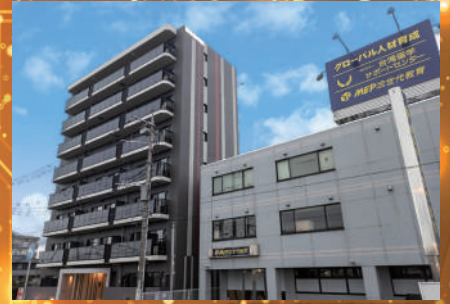
プログラミング合宿所(左)と教室(右)

IT・AI人材が世界で2020年に37万人(日本で5万人)、2030年に79万人(日本で10万人)以上不足すると日本の経済産業省が発表しています。これらの人材は現在、企業からの争奪戦になっており、スキルを持った人の年収も右肩上がりです。しかしながら、日本はこの分野の人材が極端に不足しており、世界からかなり遅れをとっていると言わざるを得ません。日本でも遅ればせながら、2021年から中学校、2022年からは全ての高校でプログラミング教育が義務化され、2024年から大学入試でパソコンを使うテストが導入される予定です。