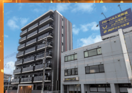
プログラミング合宿所(左)と教室(右)

IT・AI人材が世界で2020年に37万人(日本で5万人)、2030年に79万人(日本で10万人)以上 不足 すると日本の経済産業省が発表しています。これらの人材は現在、 企業からの争奪戦 になっており、スキルを持った人の 年収も右肩上がり で上昇し続けています。しかしながら、日本はこの分野の人材が極端に不足しており、世界からかなり遅れをとっていると言わざるを得ません。日本でも遅ればせながら、2021年から中学校、2022年からは全ての高校で プログラミング教育が義務化 され、2024年から大学入試でパソコンを使うテストが導入される予定です。